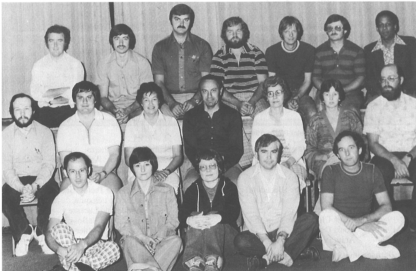
Personnel de l'Institut collégial Saint-Pierre, 1976-77