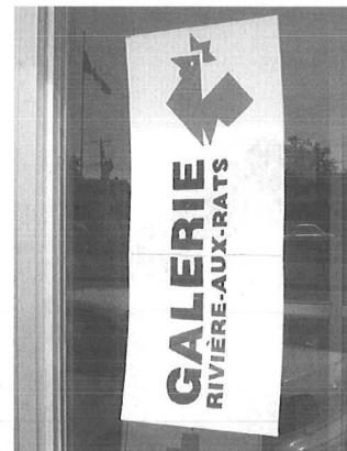
La Galerie Rivière-aux-Rats