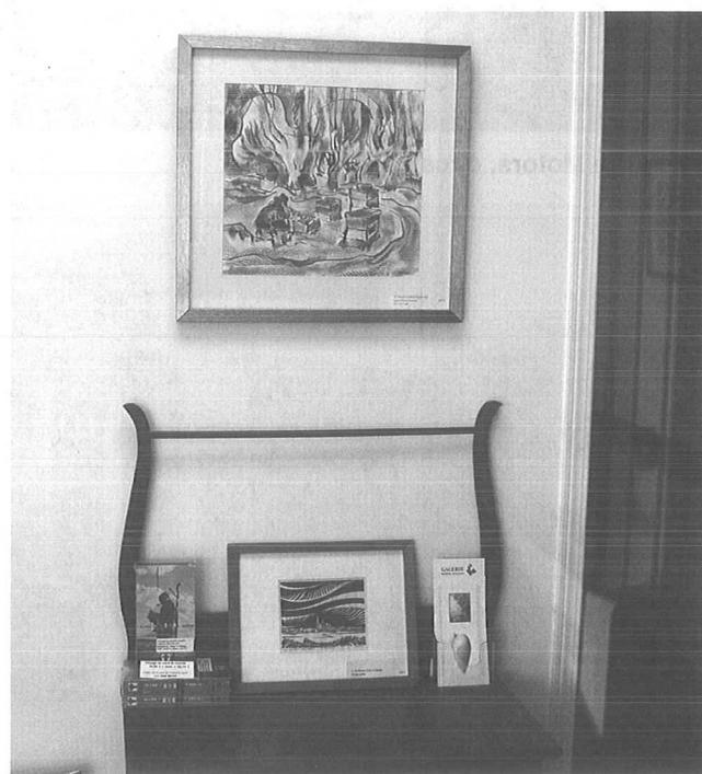
La Galerie Rivière-aux-Rats